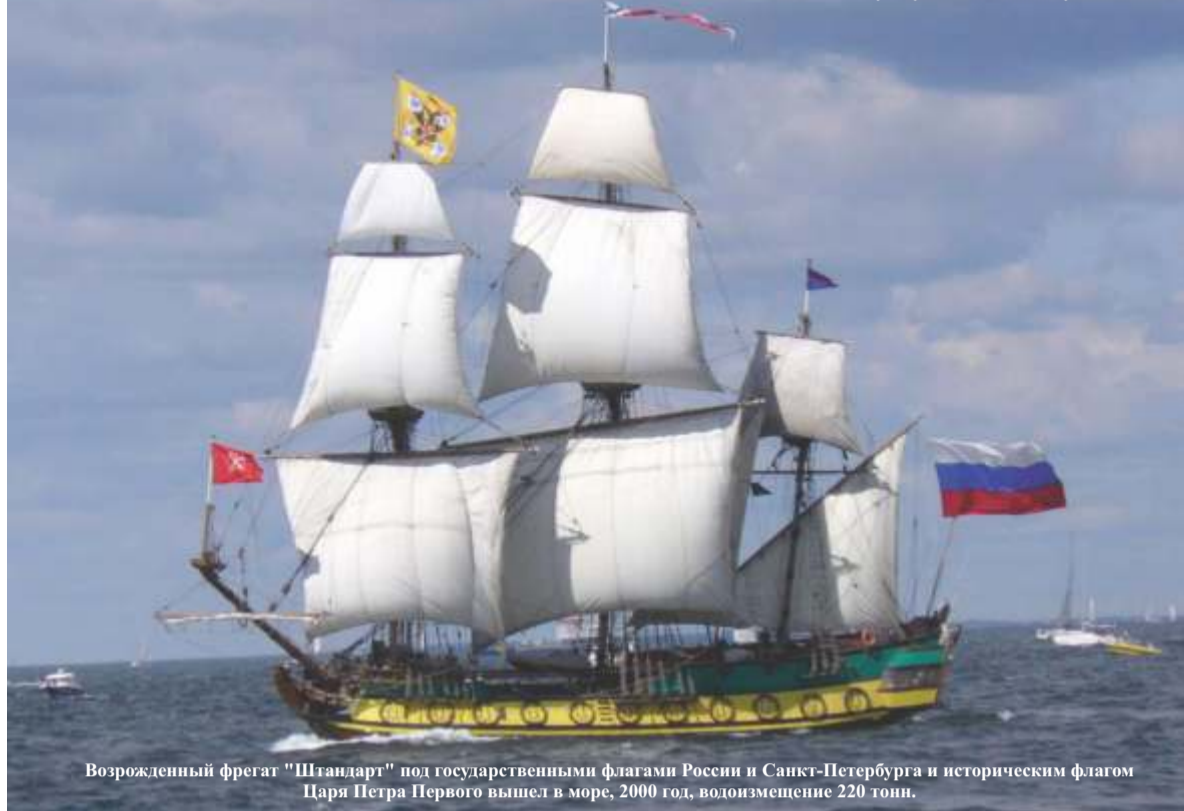
Возрожденный фрегат "Штандарт" под государственными флагами России и Санкт-Петербурга и историческим флагом Царя Петра Первого вышел в море, 2000 год, водоизмещение 220 тонн.

В результате Февральской революции 1917 года последний русский император Николай Второй, 1894–1917 годы, отрекся от престола в пользу своего брата, великого князя Михаила Александровича, который, в свою очередь, передал власть Временному правительству. Отречение Николая Второго произошло 2 марта (15 марта по Новому стилю) 1917 года, а 1 (14) сентября 1917 года Россия была провозглашена Республикой. В период Временного правительства государственным символом России оставался бело-сине-красный флаг вплоть