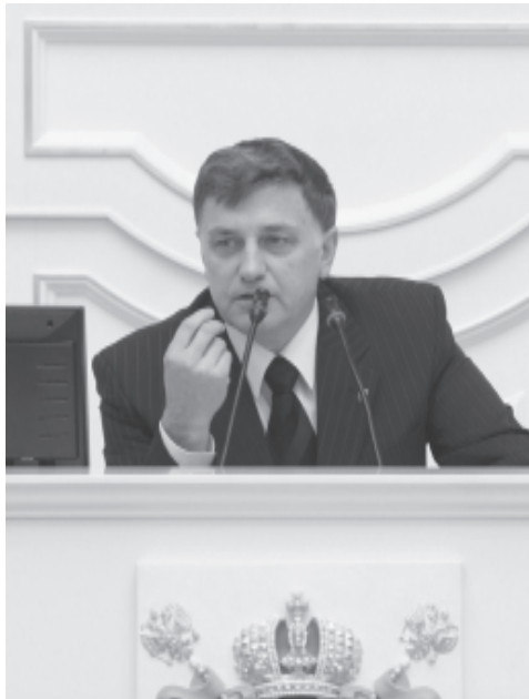
(Окончание. Начало на стр. 1)

13.6 миллиарда рублей будет в 2011 году дополнительно выделено на дорожное хозяйство. Из этих средств 6.3 миллиарда рублей будет выделено на строительство новых дорог и реконструкцию существующих. В том числе 400 миллионов рублей будет потрачено на проектирование и реконструкцию Песочной набережной и набережной Адмирала Лазарева, проектирование и строительство моста через Неву в районе острова Серный, который свяжет Петроградскую сторону и Васильевский остров. Это очень важно для жителей Петроградского района. 1.3 миллиарда рублей составят расходы на содержание дорог, и 181 миллион рублей - на содержание скверов, парков и садов.