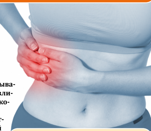
Вирусный гепатит – инфекционное заболевание, вызываемое различными вирусами, поражающими печень. Существует пять вирусов гепатита: А (болезнь Боткина), В, С, D и Е.

Некоторые пациенты, инфицированные вирусами гепати-