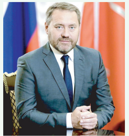
Председатель Законодательного собрания Санкт-Петербурга Александр Бельский

Дорогие друзья, пусть наступающий 2024 год принесёт в ваши дома мир и согласие, достаток и семейный уют!