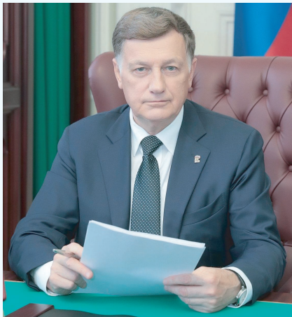
Вячеслав Макаров, депутат Государственной Думы Федерального Собрания Российской Федерации

Искренне желаю вам успехов и благополучия, а нашему любимому городу Санкт-Петербургу и нашей великой России – добра, развития и процветания!