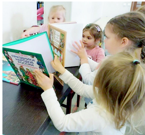
В завершение встречи посмотрели отрывок анимационного фильма о народах России «Гора самоцветов».

Дети услышали рассказ о народах, живущих в России, и с удовольствием приняли участие в играх народов нашей многонациональной Родины: «Хоровод» (русская народная игра), «Покорми оленя» (игра народов Севера), «Кружиться вокруг колышка» (калмыцкая народная игра), «Оседлай коня» (игра народов Кавказа), «Рыбалка» (игра народов Дальнего Востока).