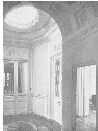
Фрагмент интерьера особняка Новинских. Историческое фото.