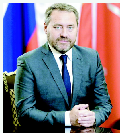
Председатель Законодательного собрания Санкт-Петербурга Александр Бельский

Дорогие петербуржцы, от всей души желаю вам крепкого здоровья, мира, добра, семейного счастья и благополучия! Пусть вас всегда согревает тепло домашнего очага, любовь родных и близких людей. Пусть в новом году в жизни каждого из вас, каждой семьи произойдут перемены к лучшему!