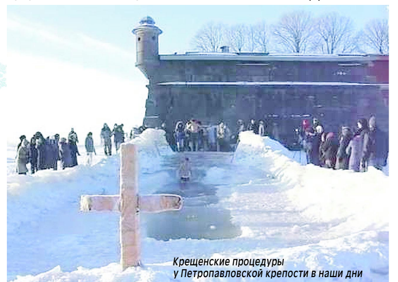
Крещенские процедуры у Петропавловской крепости в наши дни

Адриана и Наталии а также дарохранительница, пожертвованная Павлом I. Стены внутри были «разделаны» под мрамор и декорировали орнаментом. ажурная решетка ограждала устроенный на хорах балкон.