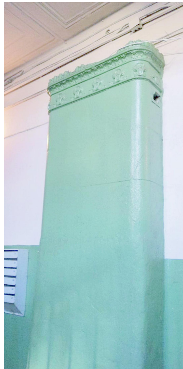
Б. Зеленина, 28. В холле парадной лестницы изразцовая печь, покрашенная краской. Фото 2013 г.