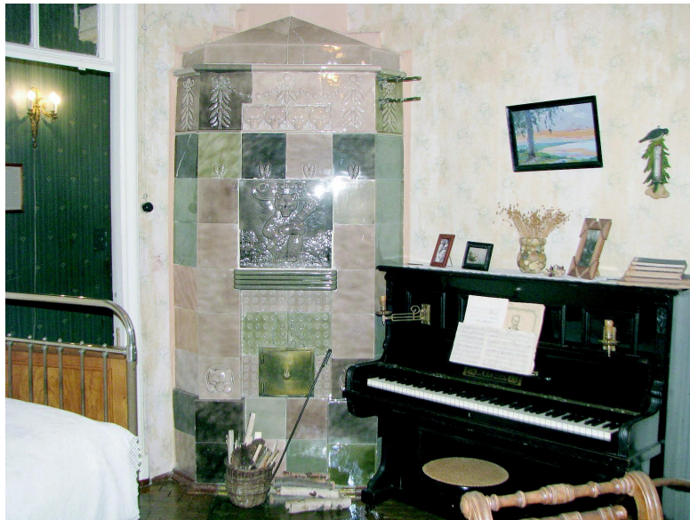
Печь в интерьере жилой комнаты. Ул. Ленина, 52 кв. 24

Первым отделять печи кровельным железом предложил Иоганн Генрих Утермарк – архитектор эпохи Александра I. Эти печи в обиходе так и называют – утермарковские. Они обязательно цилиндрической формы и достаточно простой конструкции. Такие печи особенно были востребованы в послеблокадном Ленинграде, когда отопление в жилых домах, в основном было печным. Но с появлением повсеместно-