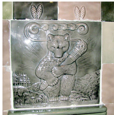
Фрагмент плитки на печи. Ул. Ленина, 52 кв. 24

Сегодня, когда отопление подается централизованно в каждую квартиру, про печи и камин хранители быта не забыли. Еще в конце 1990-х начале 2000-х годов благодаря энтузиазму заведующего филиалом Эрмитажа – Меншиковским дворцом – Владимиру Мещерякову, в открывшемся после реконструкции и реставрации дворце были собраны и частич-