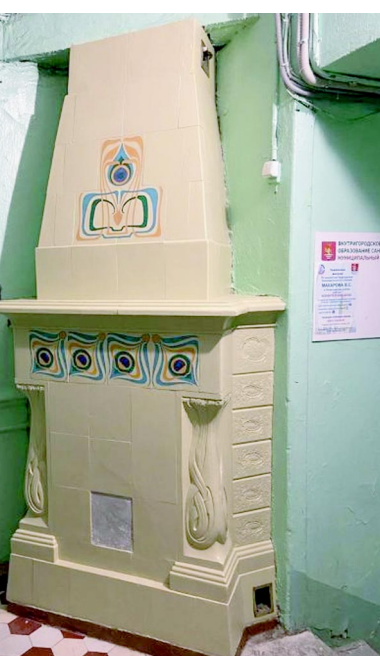
Камин в холле парадной лестницы. Чкаловский пр., 45.

Кроме того, в 2018 году в казематах Государева бастиона Петропавловской крепости Музеем архитектурной художественной керамики «Керамарх» была представлена для всех желающих постоянная выставка, неотъемлемой частью которой кроме изразцовых фрагментов отделки фасадов зданий являются и отреставрированные печи, и камин города. Тема, которую мы сегодня презентовали, поистине неисчерпаема. Мы не можем себе даже представить приблизительную цифру сохранившихся в особняках, дворцах, доходных домах и прочих строениях города, печей и каминов. Но и не можем себе отказать в удовольствии прогуляться по любимым местам, чтобы воочию увидеть сохраненное богатство. Тем более, что сегодня есть масса специализированных экскурсий.