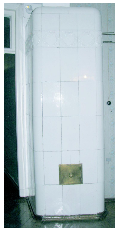
Печь в гостиной. Ул. Ленина, 52 кв. 24

А. С. Пушкин как-то заметил, что «...в Петербурге камин никогда не лишнее». А мы добавим: «...и всегда красиво!».