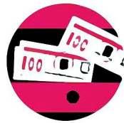
Возросшая потребность в деньгах