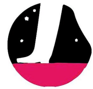
Изменение режима сна, бытовых привычек