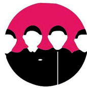
Изменение круга общения