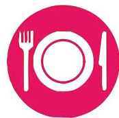
Изменение пищевых привычек