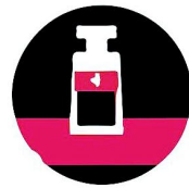
Повышенный интерес к фарм. препаратам