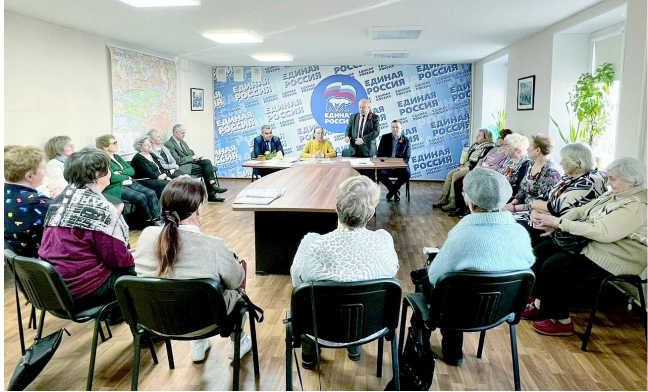
На фото: На юбилейном торжестве Совета ветеранов

Дорогие друзья! Поздравляю вас с 35-летием со дня образования общественной ветеранской организации Петроградского района! Желаю всем здоровья, тепла, уюта и благополучия. Не стареть душой и вести активный образ жизни!