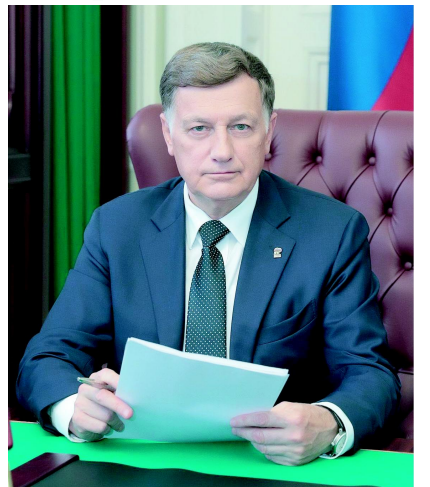
Вячеслав Макаров, депутат Государственной Думы Федерального Собрания Российской Федерации

Пусть новый год принесет каждой петербургской семье как можно больше радостных событий! Пусть всё задуманное претворится в жизнь!